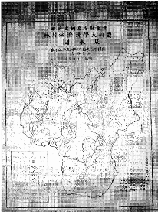
写真-1 千葉県安房国長狭郡清澄演習林基本図