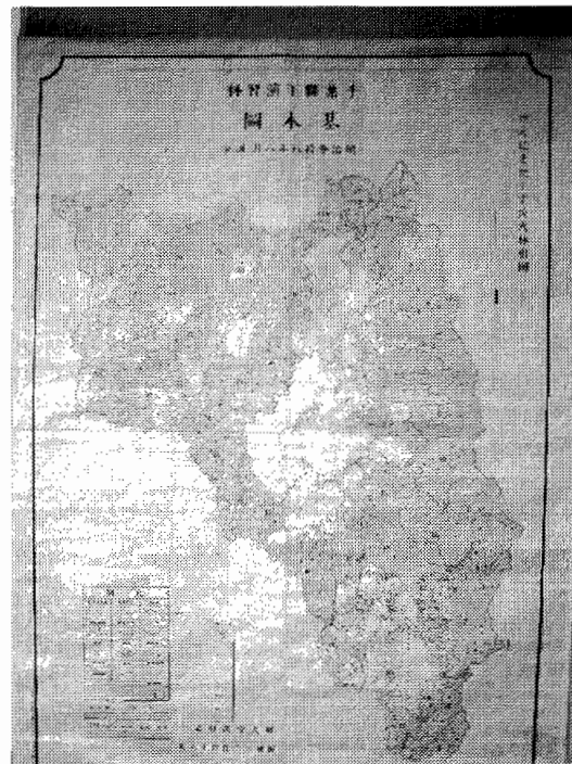
写真-4 ゲンニマターズ氏式林相図