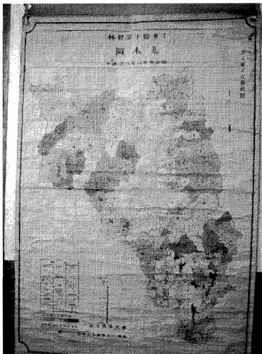
写真-3 ザクセン式林相図